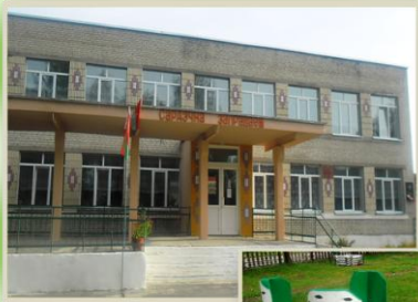
Белёвский детский сад – средняя школа