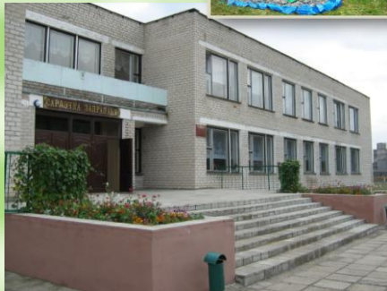
Дубровская средняя школа