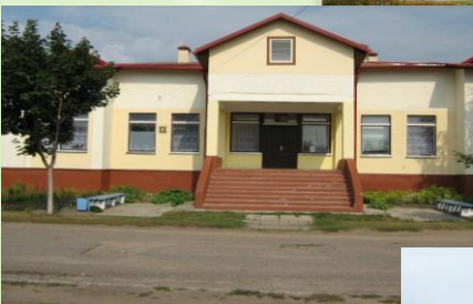
ГУО «Дубровский детский сад»