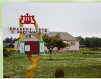
Филиал «Морохоровский клуб - библиотека»